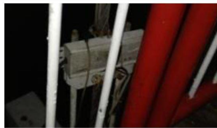
碧潭橋旁路燈，左邊的照片拍攝於 2017/05/20，右邊的照片拍攝於 2018/07/29，事隔一年再度拍攝，標籤上的字跡雖然已經模糊，不變的是它仍然在那默默地照亮橋上的人們

后来有幸加入明纬，总算开始有机会去了解这一间员工平均年资达 10 年公司的成功之道，而其中最令我佩服的是它「意正心诚」的企业文化及经营模式，所谓 A 咖吸引 A 级人才，文化并不是制造出来的，文化是群体的惯性，刚开始在明纬的研发部时觉得大家对「产品质量与技术的执着」是少数人的想法，但后来才发现这是一种文化，大部份的人都发自内心地想把事情作到最好，所谓“ Good is the enemy of great”，这是一件说起来容易，做起来却很不简单的事，在明纬作工程师不只要解决问题，更是要明确地找出问题的源头，不断地思考及尝试是不是有更好的解决方案。