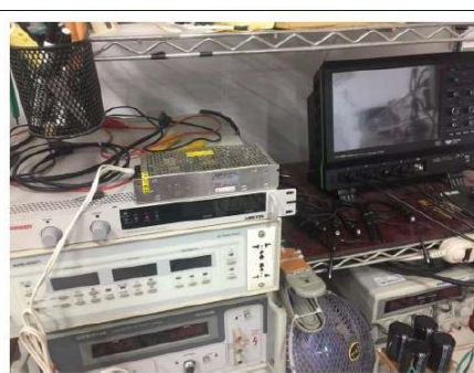
研究所時使用 S-100-12 電源作為輔助電源