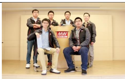
所有伟大的公司都是来自于团队合作，DRP-3200 项目团队