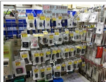
2018 光華商場店舖中所販賣的明緯產品。商場中 3C 產品來來去去，不變的是明緯的產品仍歷久彌新