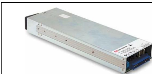
人无我有，人有我优，不断地朝向提升产品价值而努力，DRP-3200。