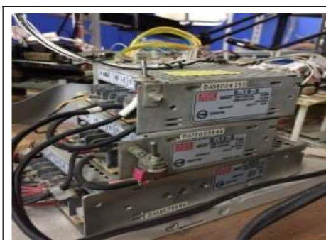
研究所時馬達控制實驗平台採用 S-15-5 電源

每一个研究生背后都有一个属于他的明纬电源，或许你当时几乎忘了它的存在，但因为有了它，作实验才能无后顾之忧。