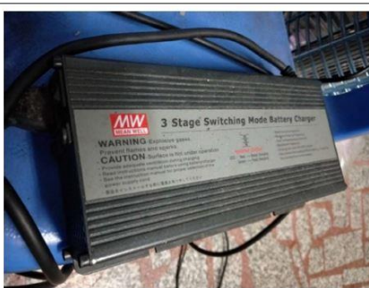
我家第一台電動機車，雖然機車已經報廢，但 PB-360 仍依舊屹立不搖

走过传统，迎向未来，「以终为始，不断改善」，明纬专注于电源本业为本，开始由半数字电源作到全数字电源，从三合一调光作到 DALI，KNX，Wireless，从电源通讯到智能建筑，在过往的基础上一步步向前，电源智能化，控制数字化，韧体中心渐渐地扮演更吃重的角色，在不断追求「永无休止的创新与改善」的同时，不变的是对质量的坚持，而每一张照片都代表着明纬朝着建构永续经营高效态幸福企业不断努力的记录。