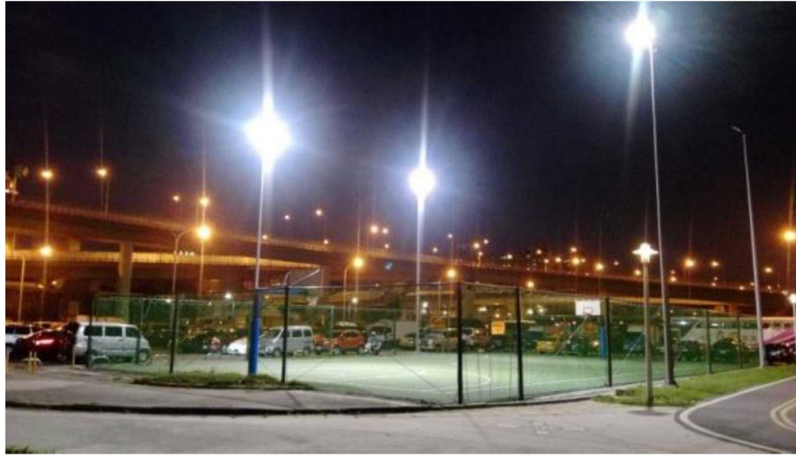
台北市彩虹河濱公園 1000W 投光燈，每組投光燈使用 2 顆 HLG-480H-C