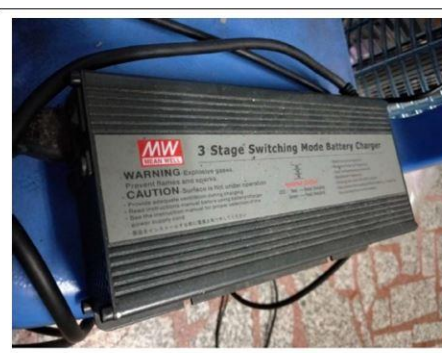
我家第一台電動機車，雖然機車已經報廢，但 PB-360 仍依舊屹立不搖

走過傳統，迎向未來，「以終為始，不斷改善」，明緯專注於電源本業為本，開始由半數位電源作到全數位電源，從三合一調光作到 DALI，KNX，Wireless，從電源通訊到智慧建築，在過往的基礎上一步步向前，電源智能化，控制數位化，韌體中心漸漸地扮演更吃重的角色，在不斷追求「永無休止的創新與改善」的同時，不變的是對品質的堅持，而每一張照片都代表著明緯朝著 建構永續經營高效態幸福企業 不斷努力的記錄。