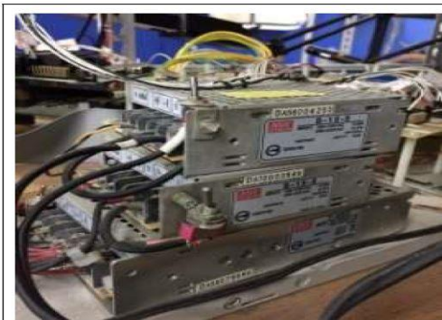
研究所時馬達控制實驗平台採用 S-15-5 電源