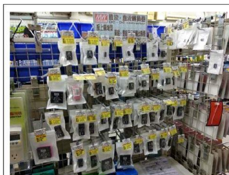
2018 光華商場店舖中所販賣的明緯產品。商場中 3C 產品來來去去，不變的是明緯的產品仍歷久彌新