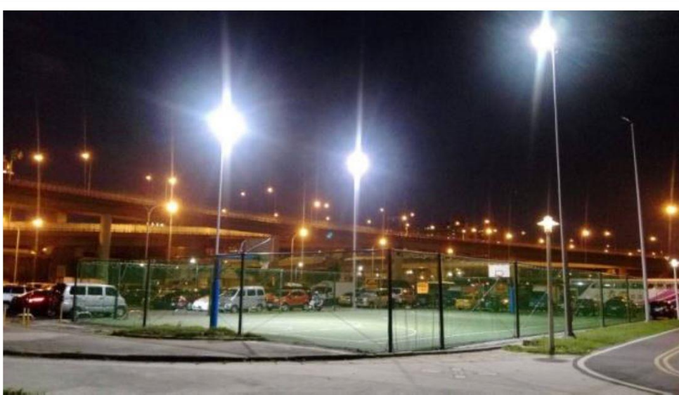
台北市彩虹河濱公園 1000W 投光燈，每組投光燈使用 2 顆 HLG-480H-C

個人曾經服務於 LED 照明公司，以前每次燈具有問題時，尤其是戶外燈具，業主都會問我採用的是那一家的電源，只要回答用的是明緯的電源，從來就沒有業主會抱怨。「您信賴的電源夥伴」，不是一句口號，而是一種對於明緯高品質產品與服務的肯定。