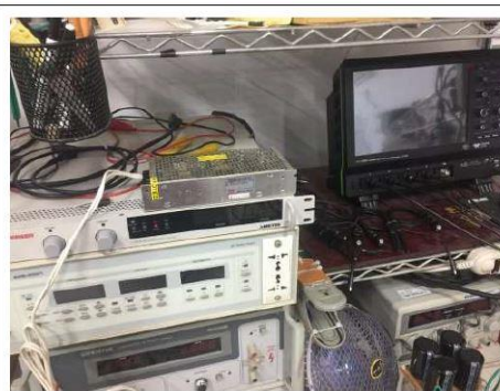
研究所時使用 S-100-12 電源作為輔助電源