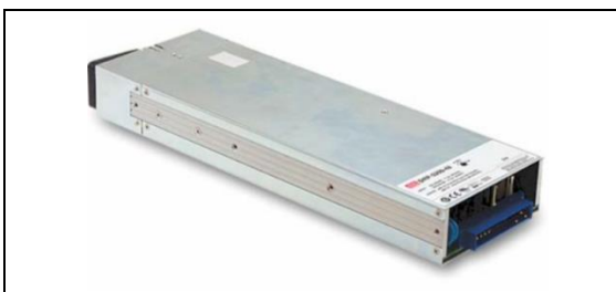
人無我有，人有我優，不斷地朝向提昇產