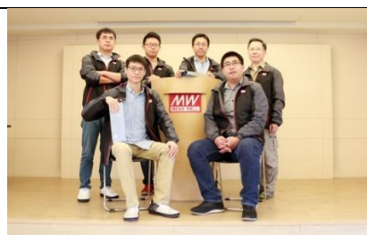
所有偉大的公司都是來自於團隊合